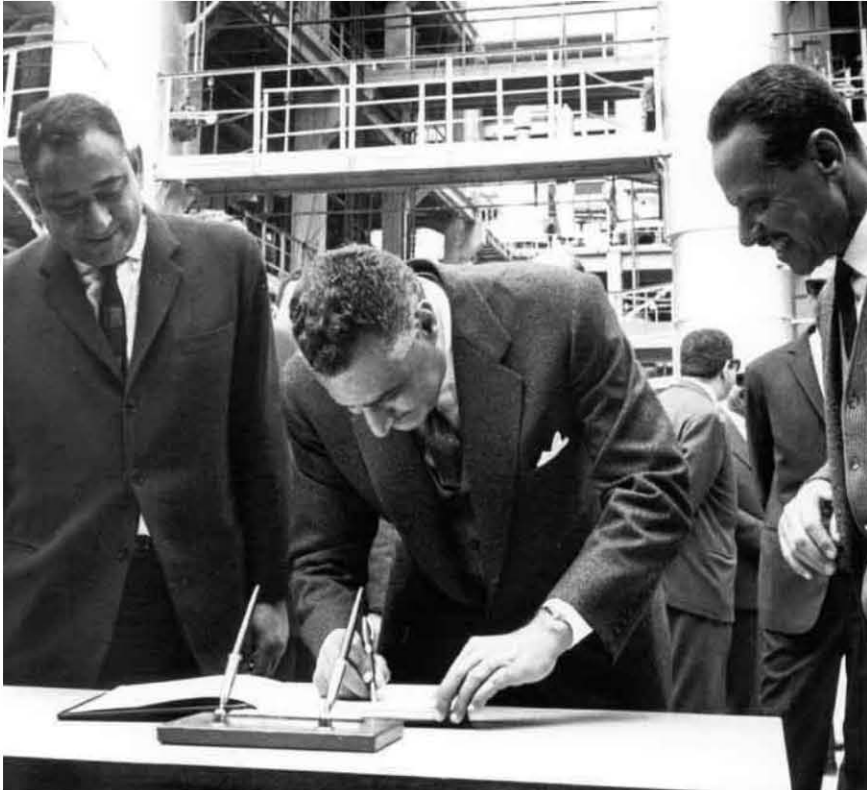
إفتتاح مصنع الزيوت فى السويس بمناسبة عيدها القومى الأول